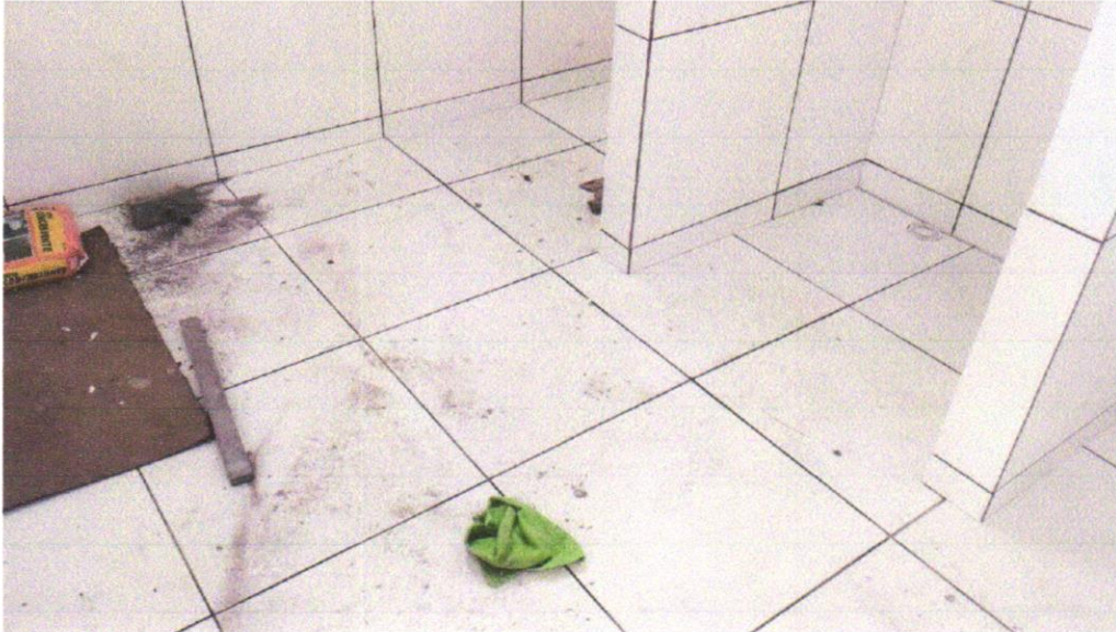
IMAGEM 01 – REVESTIMENTO CERÂMICO PARA PISO COM PLACAS TIPO ESMALTADA EXTRA DE DIMENSÕES 45X45 CM APLICADA EM AMBIENTES DE ÁREA MAIOR QUE 10 M2. AF_06/2014