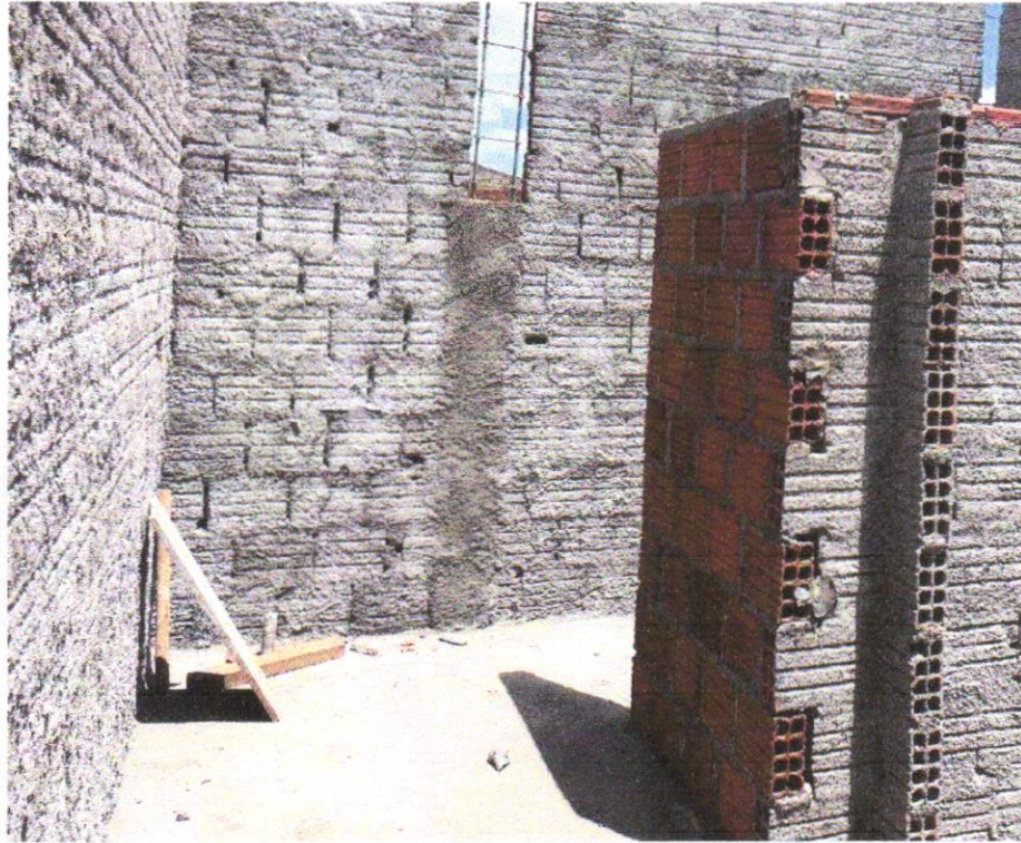
IMAGEM 05 - CHAPISCO APLICADO EM ALVENARIA (COM PRESENÇA DE VÃOS) E ESTRUTURAS DE CONCRETO DE FACHADA, COM COLHER DE PEDREIRO. ARGAMASSA TRAÇO 1:3 COM PREPARO EM BETONEIRA 400L. AF_06/2014