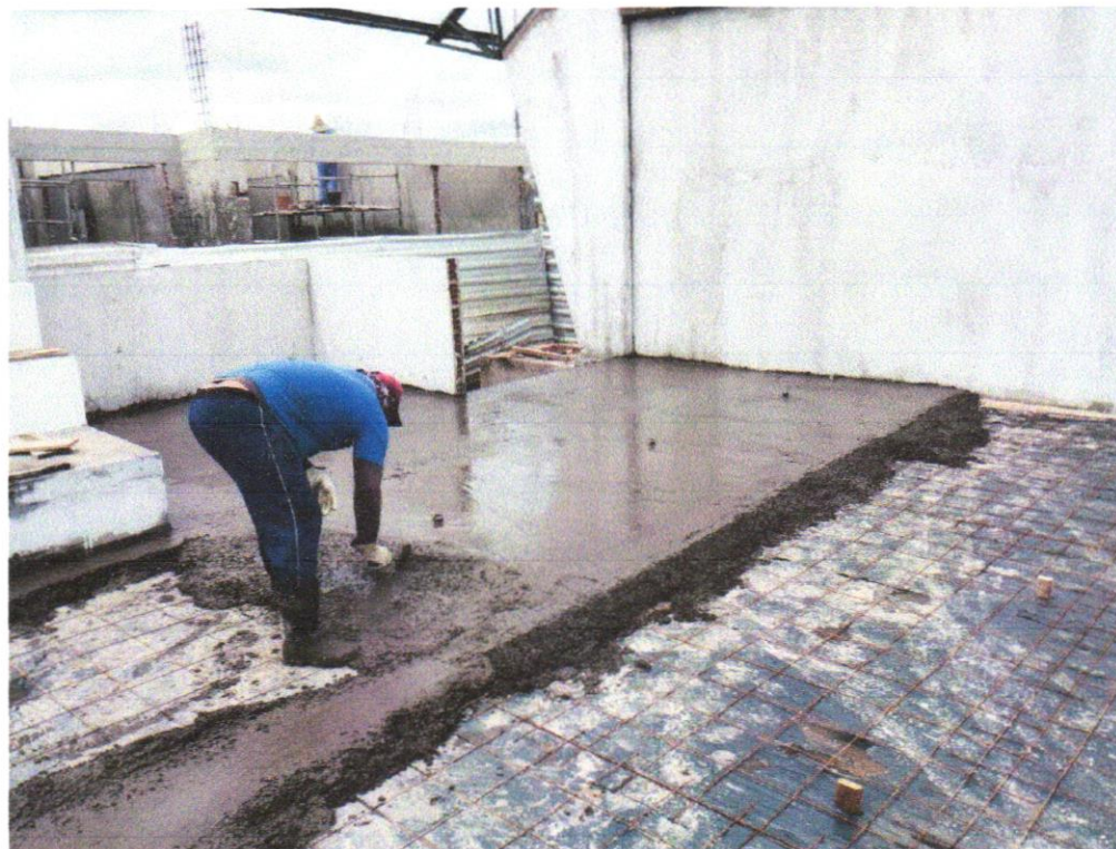
IMAGEM 07 - Piso alta resistencia, cor cinza, e=10mm, aplicado com juntas, polido até o esmeril 400 e encerado, exclusive argamassa de regularização