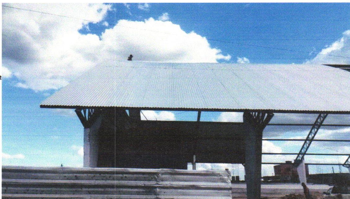
IMAGEM 04 - Telhamento com telha metálica em chapa de aço galvanizado natural ondulada e=0,5mm

RIACHÃO DO JACUIPE-BAHIA, 25 DE FEVEREIRO DE 2025