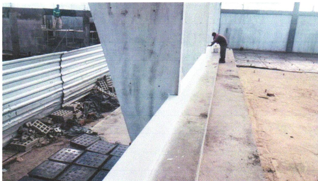
IMAGEM 08 - APLICAÇÃO MANUAL DE MASSA ACRÍLICA EM PAREDES EXTERNAS DE CASAS, DUAS DEMÃOS. AF_05/2017

RIACHÃO DO JACUIPE-BAHIA, 25 DE FEVEREIRO DE 2025