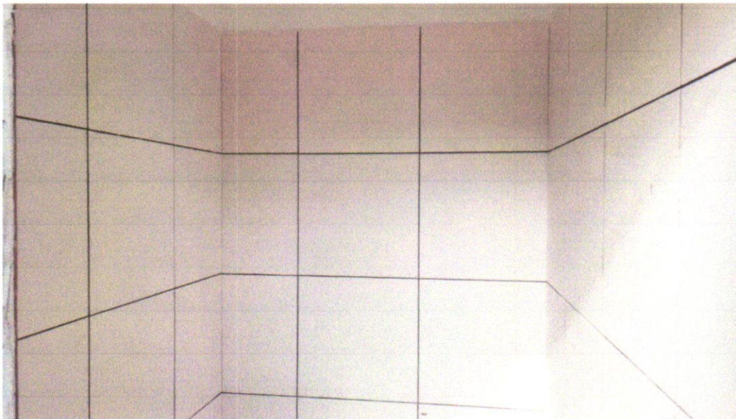
IMAGEM 02 – REVESTIMENTO CERÂMICO PARA PAREDES INTERNAS COM PLACAS TIPO ESMALTADA EXTRA DE DIMENSÕES 33X45 CM APLICADAS EM AMBIENTES DE ÁREA MENOR QUE 5 M 2 NA ALTURA INTEIRA DAS PAREDES. AF_06/2014

RIACHÃO DO JACUIPE-BAHIA, 25 DE FEVEREIRO DE 2025